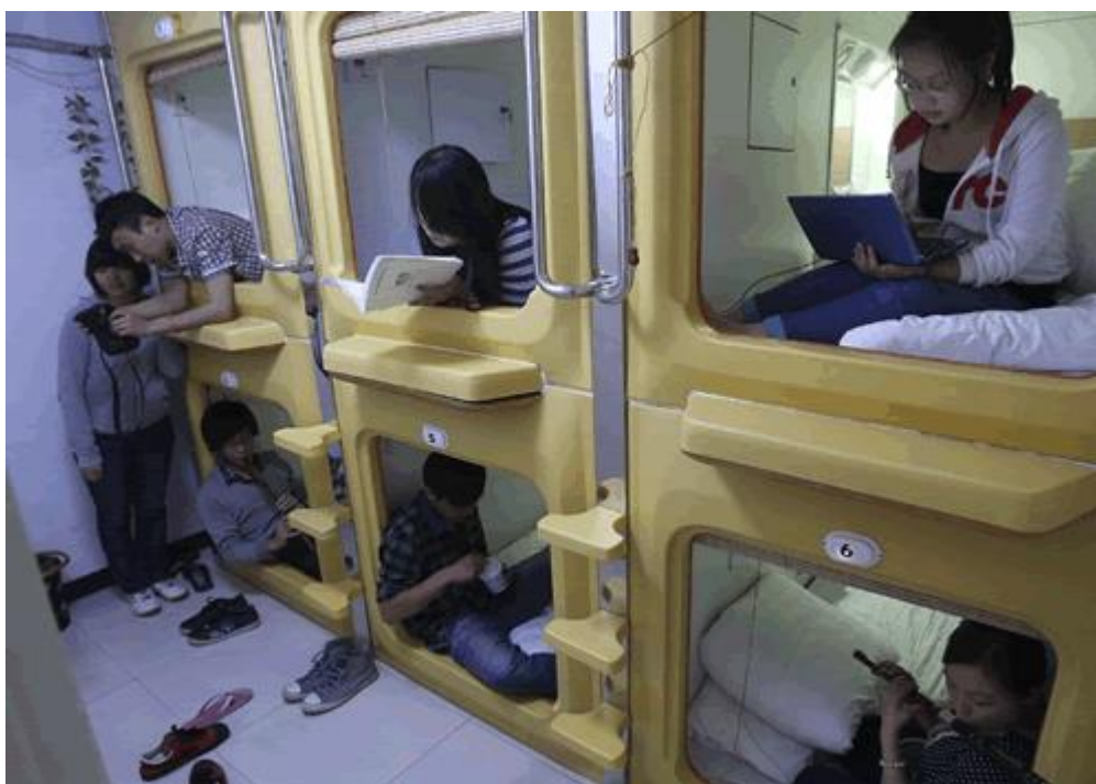
令人辛酸的胶囊公寓

对于高房价，政府一直在试图通过政策予以调控。例如：2005年有“国八条”、2006年有“国六条”、2009年有“国四条”，2011年有“新国八条”，2013年有“新国六条”及之后的“新国六条细则”。政府不断的出台关于调节房地产市场的政策,并且政策越来越严格，这说明中国的房地产市场的确存在问题,而且还是影响国民经济全局的严重问题，可遗憾的是，房地产市场好象根本没有准备给这些政策“面子”，城市房价仍然一路高歌。高房价问题不仅仅出现在大城市，早已向小城市、小城镇蔓延，让大多数城市居民和想在城市定居的农民望而却步。