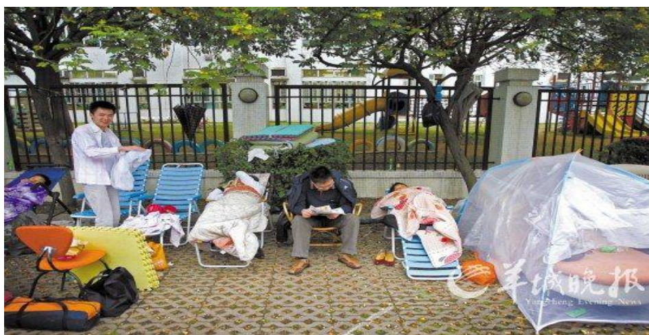
家长通宵排队入托

多年来,我们在发展理念上有偏差。一是重“面子”轻“里子”。受以GDP为主的干部任用考核机制的影响,有些城市急功近利,大搞形象工程、政绩工程,重地上建设轻地下建设,重视看得见摸得着的“脸面工程”,忽视社会事业的协调发展。二是“以物为本”根深蒂固,“以人为本”轻描淡写。将城市建设等同于扩建城市道路、修建漂亮广场和豪华标志性建筑;将发展第三产业等同于建饭店、盖商场,对与老百姓生活息息相关的基础设施建设怠于改善。三是建设方案贪大求洋,一味追求“新、奇、特、最”,却很少考虑配套设施的建设和就业岗位的增加。理念的偏差导致公共设施缺乏、交通拥挤不堪、出行费时费力、上学难、就医难等诸多“城市病”越来越严重,城市居民的生活质量和幸福感每况愈下。