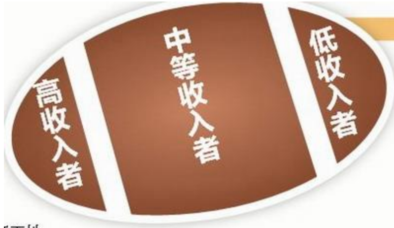
“橄榄型”社会结构图型