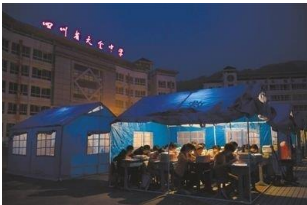
震前开展逃生演练 地震未造成伤亡

在上课的学生按日常演习指定路线，快速、有序的集中到操场，没一个同学伤亡，整个过程只用了一分半。