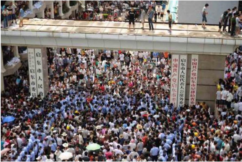
2012年7月28日江苏省启东市因“南通排海工程”而引发的群体性事件