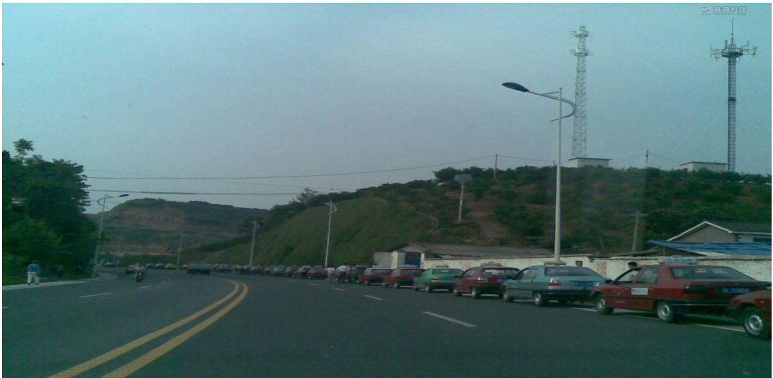
等待加气的出租车

新世纪，城市资源短缺由局部城市逐渐蔓延至全国，形式越来越严峻，已成为我国城镇化发展的重要制约因素。